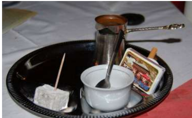
Lutvina kahva iz Travnika

Duboko ukorijenjena tradicija gostoljubivosti u Bosni i Hercegovini vidljiva je kroz gostoljubivost u gradovima i planinskim selima, u tradiciji razgovora uz kafu, u kulturi razgovaranja kao i u praznom fildžanu (šoljici) kafe postavljenoj za nenadanog gosta. „Pravi“ turistički vodič u Bosni i Hercegovini će reći: Nećemo praviti tradicionalnu kafe pauzu u atraktivnom tradicionalnom ambijentu ako imamo vremena odsjediti samo desetak minuta. Za shvatanje smisla bosanskohercegovačkog tradicionalnog kafenisanja potrebno je najmanje četiri-pet puta više vremena.