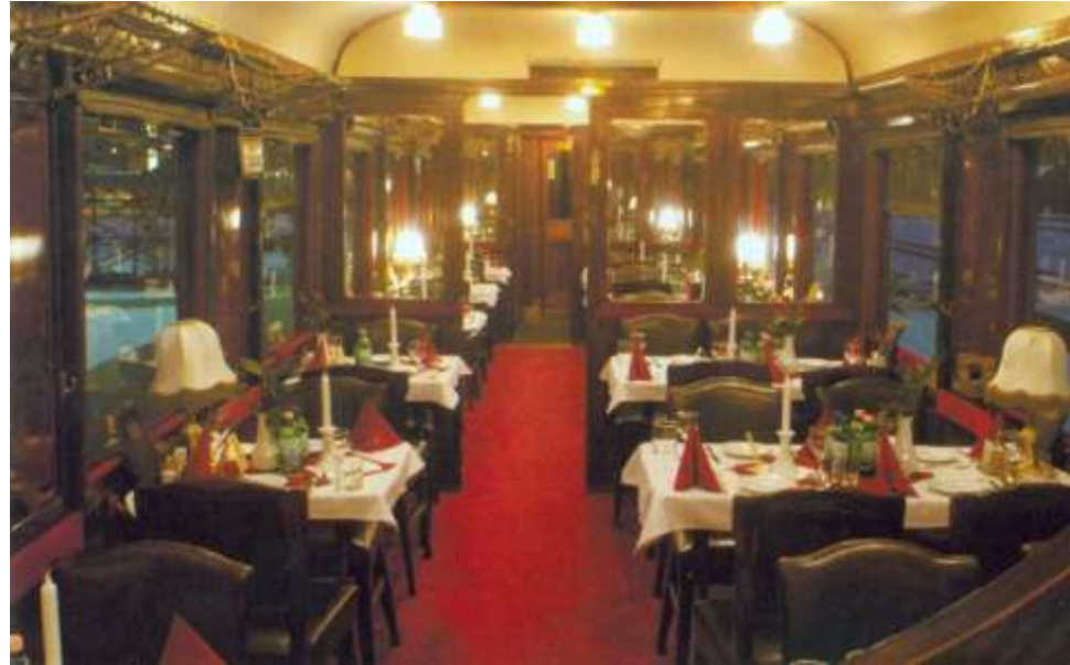
Nostalgija željeznici i turističkim vozovima nije bitna brzina prijevoza, a ulaganja su mala

EU je u ovome trenutku zainteresirana za dva velika projekta u Jugoistočnoj Evropi. Prvi je stvaranje eko-zona i turističkih itinerera (eko, agro, sakralni, historijski, kulturni i sl.) na području cca 300 km. od obala Jadranskog mora. Drugi je stvaranje regionalnog željezničkog i avio saobraćaja i turističkog proizvoda zapadnog Balkana, namijenjen prekookeanskom tržištu.